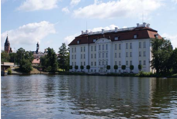
Schloss Köpenick, tegenover Linssen yachts