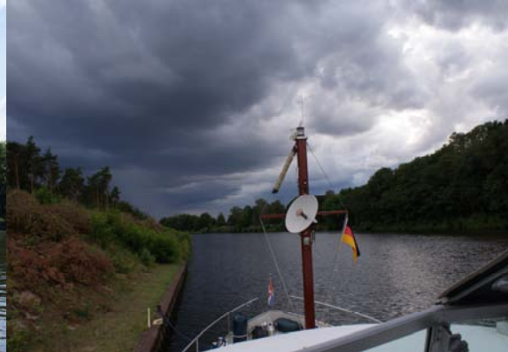
Hier mochten wij niet liggen in het Elbe Havel Kanaal