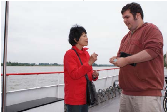
Veerman bij Rees en klein duimpje

en om 15:00 zijn we bij Rees en overnachten daar heel rustig in een jachthaven in een zandafgraving aan de andere oever. We hebben 45 km gevaren in 6 uur en hadden wel zin in wandeling en zijn daarom direct met het pontveer naar Rees overgestoken. Helaas waren alle restaurants gesloten.