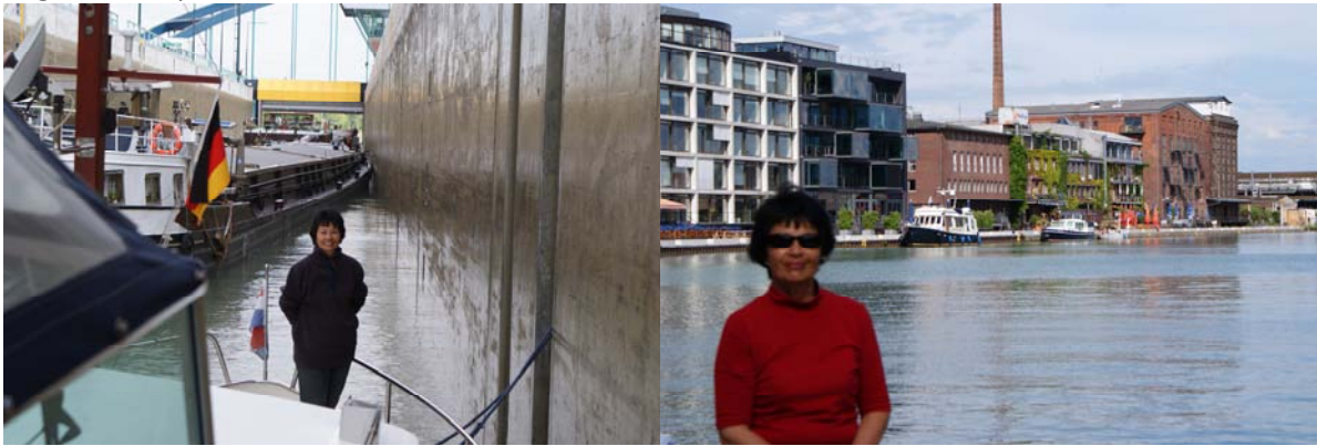
Grote sluis bij Münster

De volgende morgen op naar het laatste gedeelte van ons eerste Hoofdstuk: Marina Recken, 6km verderop in stromende regen en stormachtige wind. Een prima jachthaven, maar eigenlijk niet ingericht voor schepen van onze afmeting. Een fenomeen dat we nog veel vaker zouden tegenkomen. Omdat veel havens kleine kommetjes zijn naast het kanaal, wordt het water door een passerend vrachtschip voor een groot deel weggezogen en dat ligt niet prettig. Zelfs in een heel grote kom zoals bij Marina Recke was dit al het geval. Wij prefereren daarom een ligplaats in het kanaal. Die zijn prima en vrachtschepen minderen vaart als ze sportboten aan de kant zien liggen, in Nederland een onbekend fenomeen, in Duitsland heel normaal. De max. snelheid is trouwens maar 12 km en iedereen houdt zich daaraan! Er wordt ook streng op gecontroleerd en je ziet ook minstens tweemaal per dag de waterpolitie.