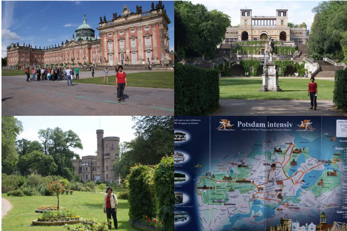
Boven: das Neue Palast uit 1760

ter terug in Berlijn. Buitenlandse gasten werden hier ontvangen. De grandeur is hier gelijk aan Parijs en Londen.