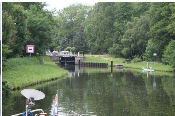
Eén van de vele sluisjes onderweg