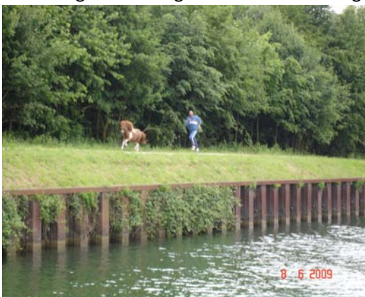
Man en paard

Om 15:30 meerden we af aan de kade in Datteln na de 5 e sluis en bevonden ons toen in het Dortmund-Emskanaal. Datteln is een leuk plaatsje en dus ook hier doorheen gewandeld en boodschappen gedaan. Het weer werd stilaan wat beter. We hebben 47 km gevaren en het kanaal is zeker niet vervelend. Dinsdag 9-jun naar Münster, waar we afmeren in de stadshaven. Inmiddels totaal 251 km onderweg en vandaag 46 km. Hier al weer gratis ligplaats en erg gezellig en vlak bij het stadscentrum.