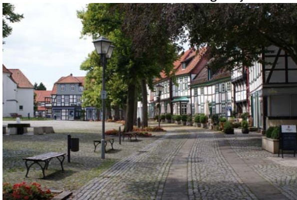
Het witte stadje Bad Essen