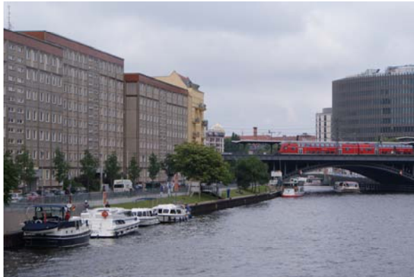
Ligplaats in het centrum