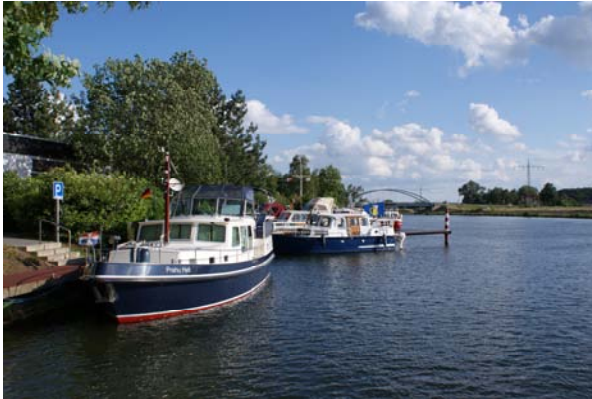
Jachthaven van de MYC Osnabrück bij Haalen

heel wat lief en leed samen gedeeld had, de zaakjes al geregeld had, maar zo ver verwijderd van onze wensen en gevoel voor vrijheid, dat wij om 20:00 na de maaltijd op onze eigen Prahu, naar het havenrestaurant zijn gegaan en maar gelijk hebben meegedeeld dat wij afzagen van een verder gezamenlijk optrekken. Onze opvattingen over vakantieavaren lagen te ver uit elkaar .