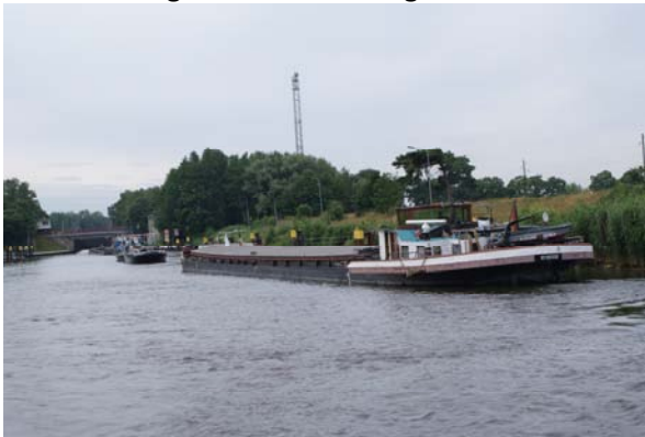
Het Havel-Elbe Kanaal