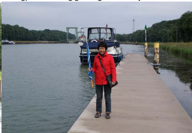
klaar voor de wandeling bij Hünxe, prima ligplaats

Natuurlijk een stevige wandeling naar het centrum gemaakt. Münster is een heerlijke stad. De volgende morgen om 09.20 bij de Schleuse Gruppe Münster 4,5 km verder. Een snelle schutting en