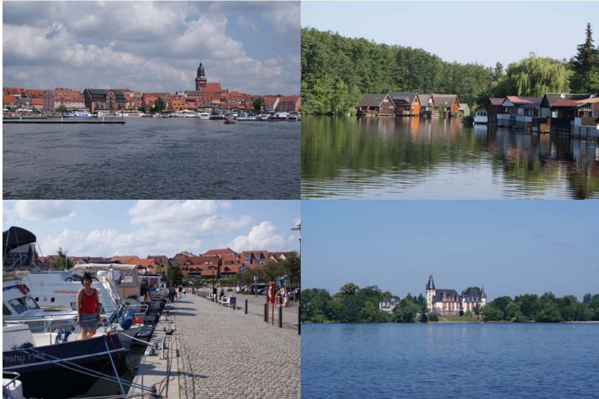
oven: Waren am Müritzsee Onder: kade van Waren