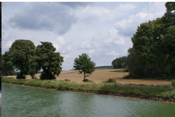
Fraaie landschappen aan het Mittellandkanaal

Op dinsdag 28-jul blijven wij een dag in Münster wij krijgen bezoek van bridgevrienden uit Nederland, die in een hotel in de omgeving zitten. Dat wordt briden en gezellig eten in één van de restau-