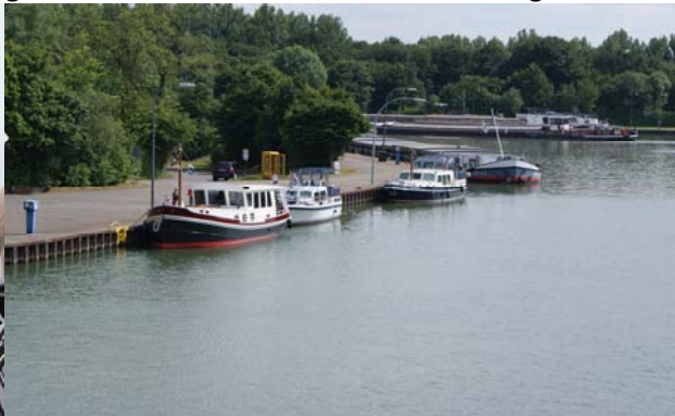
Ligplaats in het Dortmund-Emskanaal bij Datteln

De volgende dag werd het wat beter weer. Na vertrek om 9:30 waren we om 13:00 28 km verder bij Wesel. Hier verlieten we de Rijn en voeren het Wesel-Datteln kanaal op. Na lang wachten mochten we met een zeer groot vrachtschip om 15:00 mee naar binnen. Alles bijeen is de tocht over de Rijn prima verlopen. Vooral uit de buitenbochten blijven is het parool, daar varen de vrachtschepen, dus lekker de ondiepere binnenbochten nemen. Scheelt stroom tegen en dus win je niet alleen afstand, maar ook snelheid. Verder is ons opgevallen dat het ook op zondag zeer druk was met vrachtverkeer. Onze gemiddelde snelheid is 7 km geweest, terwijl de snelheid door het water 12,5 – 13 km bedroeg. Het gemiddeld toerental bedroeg 1800. We hebben overnacht voor sluis Hünxe, een prima vrije ligplaats en na de regen een leuk plekje voor een wandeling naar het dorp. Dag totaal 38 km.